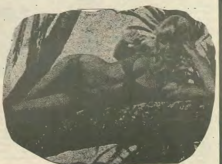
αποκομμα από "δοβαρη" εφημερίδα